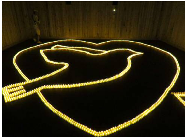
前日の準備の様子